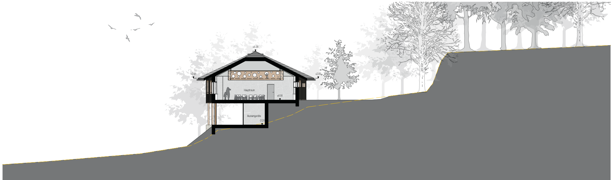
Querschnitt B-B M 1:200