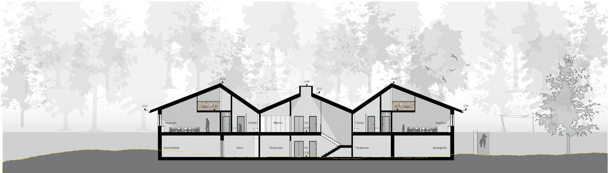
Längsschnitt A-A M 1:200