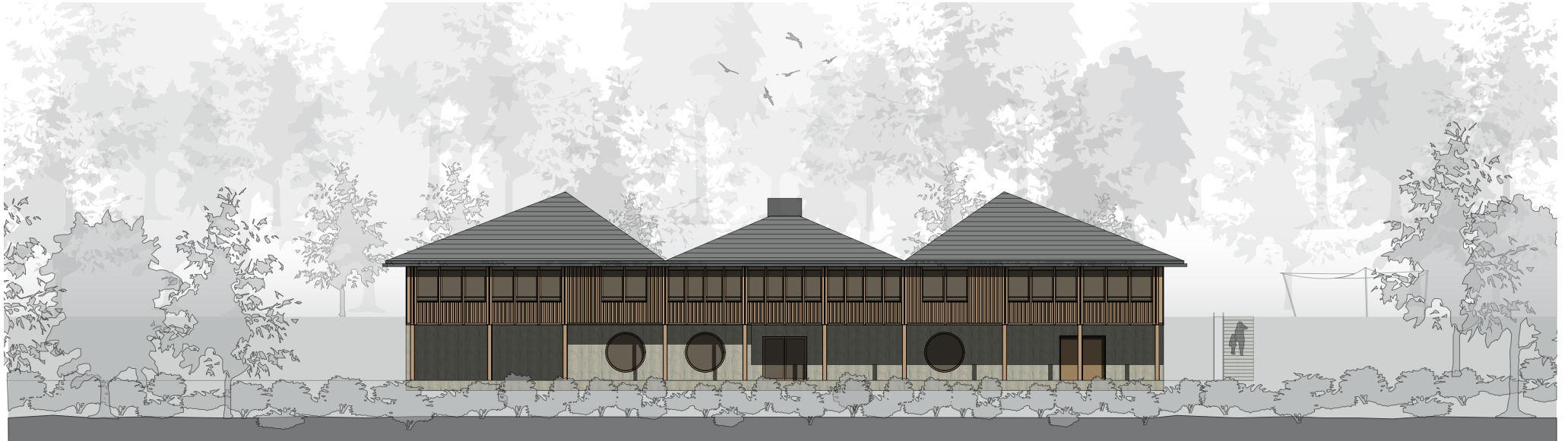
Fassade Ost M 1:200