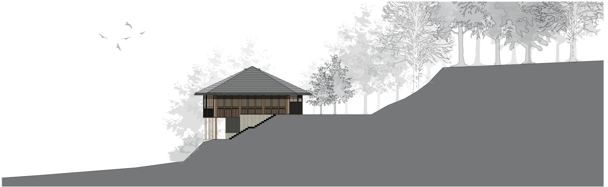
Fassade Nord M 1:200